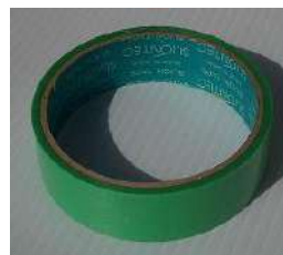
④マスキングテープ